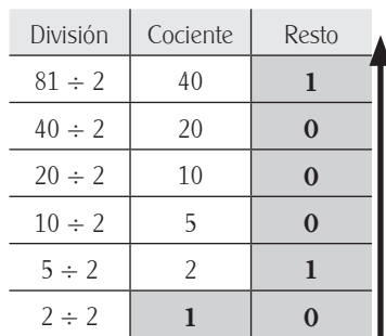
Cuadro 4 Ejemplo de conversión del número 81 en el sistema decimal a binario

ma binario. Esta conversión es sencilla, ya que simplemente requiere divisiones sucesivas entre dos hasta llegar al 1 indivisible. Esto se debe a que el sistema binario sólo tiene dos dígitos. En este momento, se cuenta el último cociente, es decir el 1 final (todo número binario excepto el 0 empieza por 1), seguido de los resultados obtenidos como resto en las divisiones realizadas, pero colocados del más reciente al más antiguo. El cuadro 4 muestra como ejemplo la conversión del decimal 81 a binario (1010001). La flecha indica el orden en el que tenemos que tomar el último cociente y todos los restos para formar el número binario.